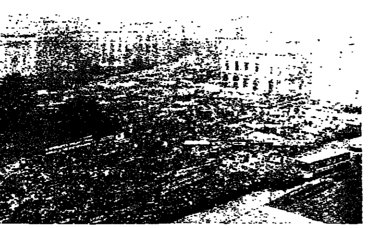
الظاهرة... قبل لحظات من الحزيرة الجديدة

وقال المتحدث باسم وزارة الخارجية الصينية، إننا نعتقد أن رومانيا تستطيع أن تحل شؤونها الخاصة بالطريقة المناسبة، وكان تشاوتشيسكو هذا القادة الشيوعيين الصينيين بفرارهم إرسال الجيش في حزيران الماضي ضد مظاهرات ربيع بكين ● وفي لايبزيغ (المنطقة الشرقية) أعلن الرئيس الفرنسي فرنسوا ميتران أمس انه لم يعد هناك سبب لاستمرار النقل الروماني، وان ايامه أصبحت معدومة، بعد القمع الدامي لمتظاهري الجماهير، واعلن الرئيس الفرنسي ان ايام هذا النظم أصبحت معدومة... وان الثمن كان فدحا... وكان الرئيس ميتران يريد على سؤال عن الوضع في رومانيا في اليوم الثاني من زيارته الرسمية لبلاتيا الشرقية.